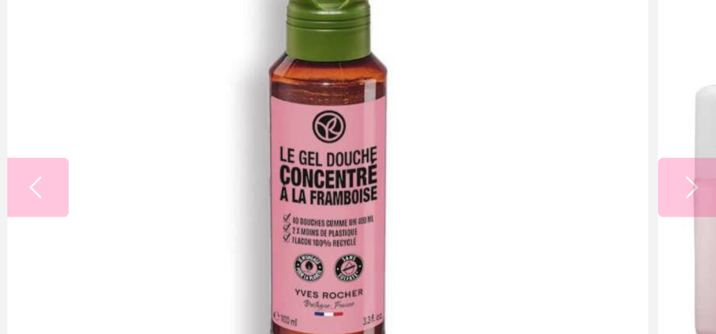
1 di 4 - Le gel doccia concentrato di Yves Rocher: ogni flacone consente sino a 40 docce.

Bagnoschioma, crema idratante leggera, gel all'aloè vera, crema defaticante per gambe stanche e un detergente solido: sono questi gli irrinunciabili per il corpo.