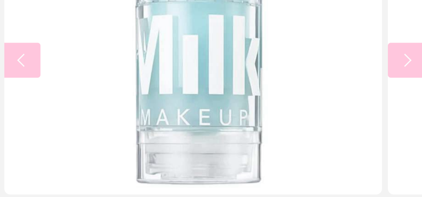
5 di 5 - Stick Idratante Milk Make-up

Per il viso i cosmetici indispensabili da viaggio sono un detergente per la mattina e uno struccante per la sera, se ci si strucca. L'ideale è un'acqua micellare, adatta per viso e occhi. Si procede poi con una crema idratante e un siero, se si è abituate a usarla: per evitare sprechi, meglio ricorrere a uno dei tanti travel set con i prodotti mini taglia. L'idea furba? Un idratante in stick che evita il problema dei liquidi da bagaglio a mano.