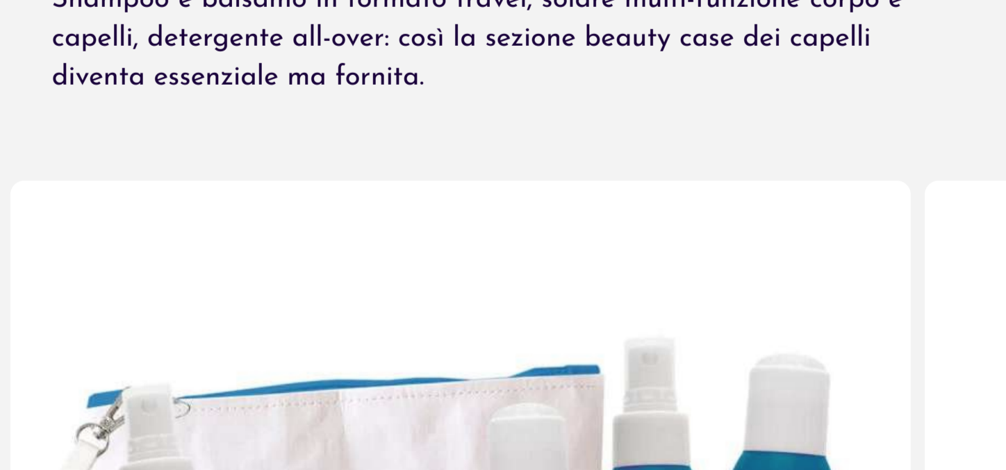
3 di 3 - Set solari per corpo e capelli di MY.ORGANICS (comprende protezione solare SPF 35, protettivo per capelli, bagno doccia e shampoo e balsamo).

Shampoo e balsamo in formato travel, solare beauty case-friendly e capelli, detergente all-over: così la sezione multi-funzione dei capelli diventa essenziale ma fornita.