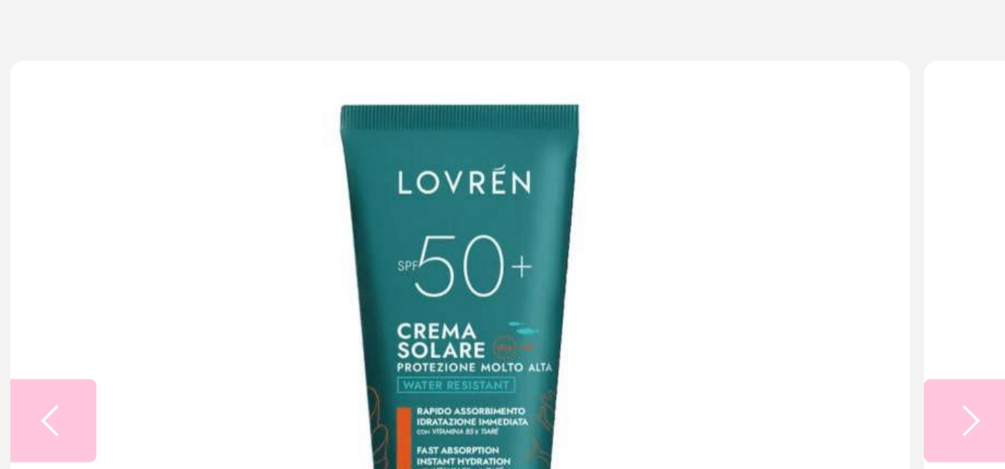
2 di 3 - Crema solare viso e corpo di Lovrén SPF50+, formato 100 ml

Per economizzare la selezione delle creme anti-UV, opta per i solari che vanno bene sia per il corpo che il viso, e un doposole che puoi usare come crema da notte per il viso o come crema corpo.