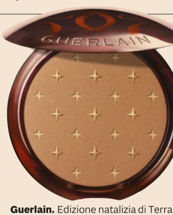
Guerlain. Edizione natalizia di Terra-cotta con pigmenti dorati