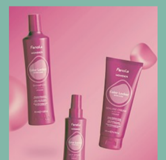
Fanola Wonder Color Locker è la linea di haircare vegana dedicata ai capelli colorati