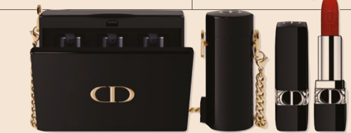
Dior. Rouge Dior Minaudière: in questa edizione limitata per le Feste 2022 Dior Addict, in 4 colori, ha una custodia couture con riflessi dorati