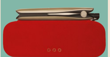
Ghd Platinum+ Grand Luxe Limited della nuova collezione per Natale

Capelli al top In salone e a casa le novità per prendersi cura dei capelli: infusioni professionali, ristrutturanti leave-on, spray volumizzanti, prodotti vegani. E ancora, speciali per il Natale, set lussuosi