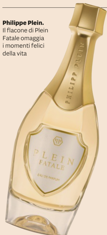
Philippe Plein. Il flacone di Plein Fatale omaggia i momenti felici della vita