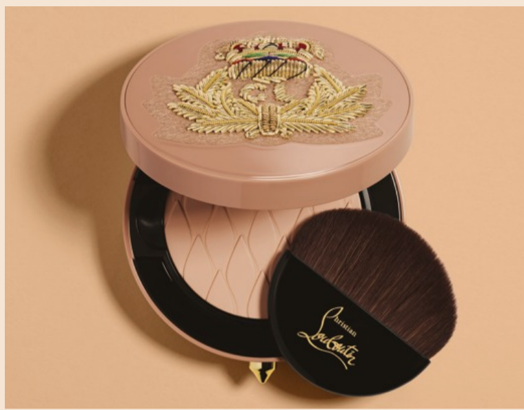
Christian Louboutin. Teint Fétique La Poudre per uomini e per donne

Il costo, in euro al chilogrammo, dei vari oli di oud, uno dei materiali più preziosi che si utilizza nella composizione di fragranze