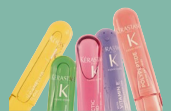
Kérastase Fusio-Dose, trattamento liquido in salone che veicola principi attivi nella fibra