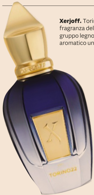
Xerjoff. Torino22 fragranza del gruppo legnoso aromatico unisex