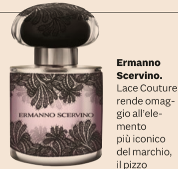
Ermanno Scervino. Lace Couture rende omaggio all'elemento più iconico del marchio, il pizzo