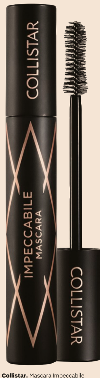
Collistar. Mascara Impeccabile

Capelli al top In salone e a casa le novità per prendersi cura dei capelli: infusioni professionali, ristrutturanti leave-on, spray volumizzanti, prodotti vegani. E ancora, speciali per il Natale, set lussuosi