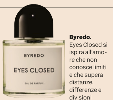
Byredo. Eyes Closed si ispira all'amore che non conosce limiti e che supera distanze, differenze e divisioni