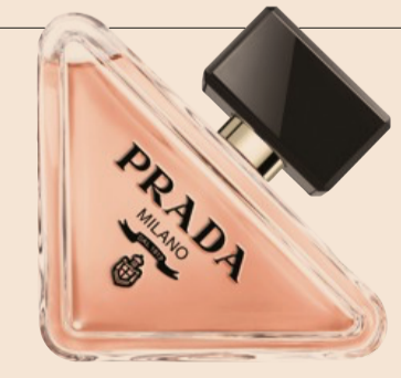
Prada. Fragranza donna Paradoxe