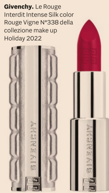
Givenchy. Le Rouge Interdit Intense Silk color Rouge Vigne N°338 della collezione make up Holiday 2022