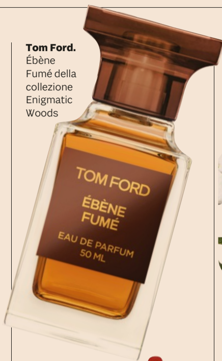
Tom Ford. Èbène Fumè della collezione Enigmatic Woods