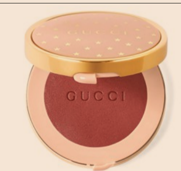
Gucci. Blush De Beauté per zigomi e occhi