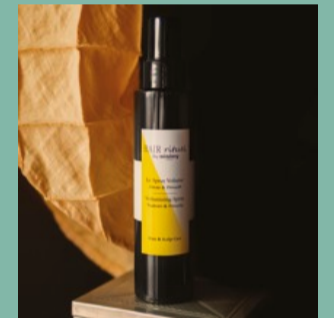
Hair Rituel by Sisley Le Spray Volume è un trattamento per il brushing che dà densità alla chioma