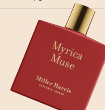
Miller Harris. Il profumo Myrica Muse