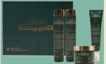
My.Organics Il kit di Natale My.Luxe Pure Gold & Neroli, luxury hair routine rigenerante