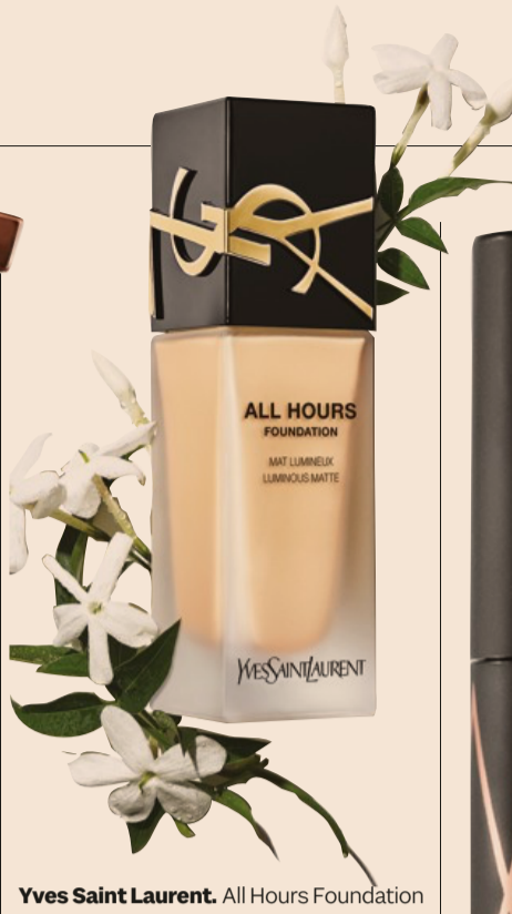
Yves Saint Laurent. All Hours Foundation