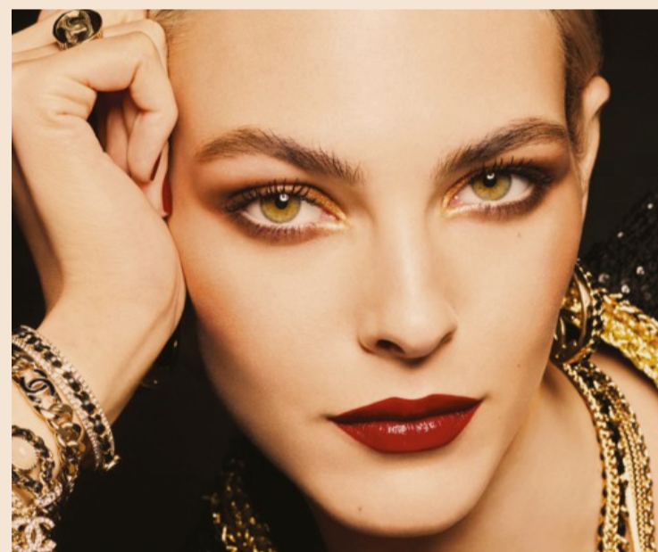
Chanel. Opulenza nel look realizzato con la Collezione Holiday 2022