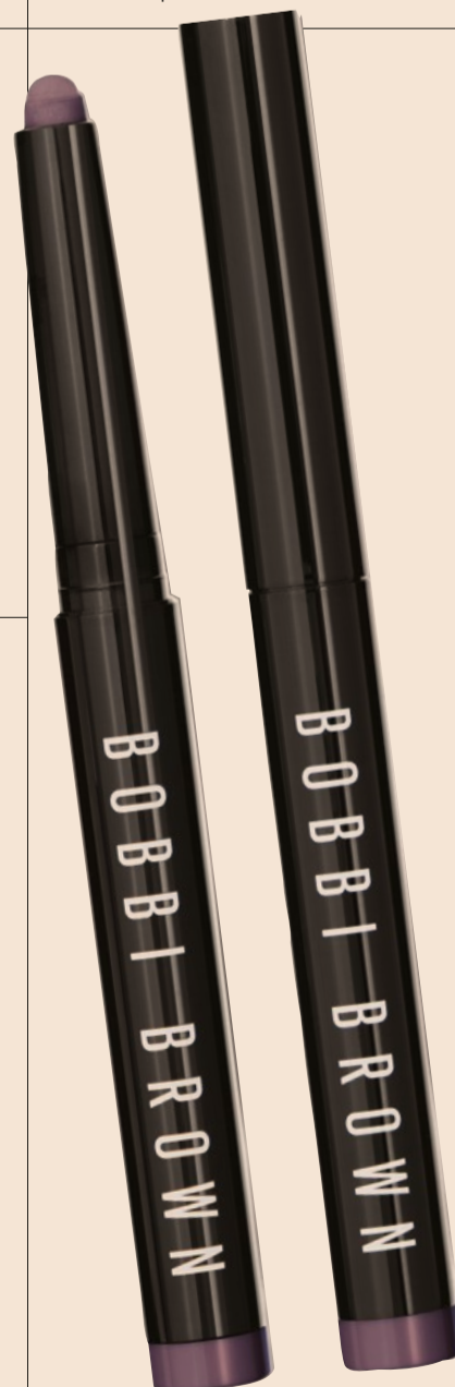
Bobbi Brown. Long Wear Cream Shadow Stick