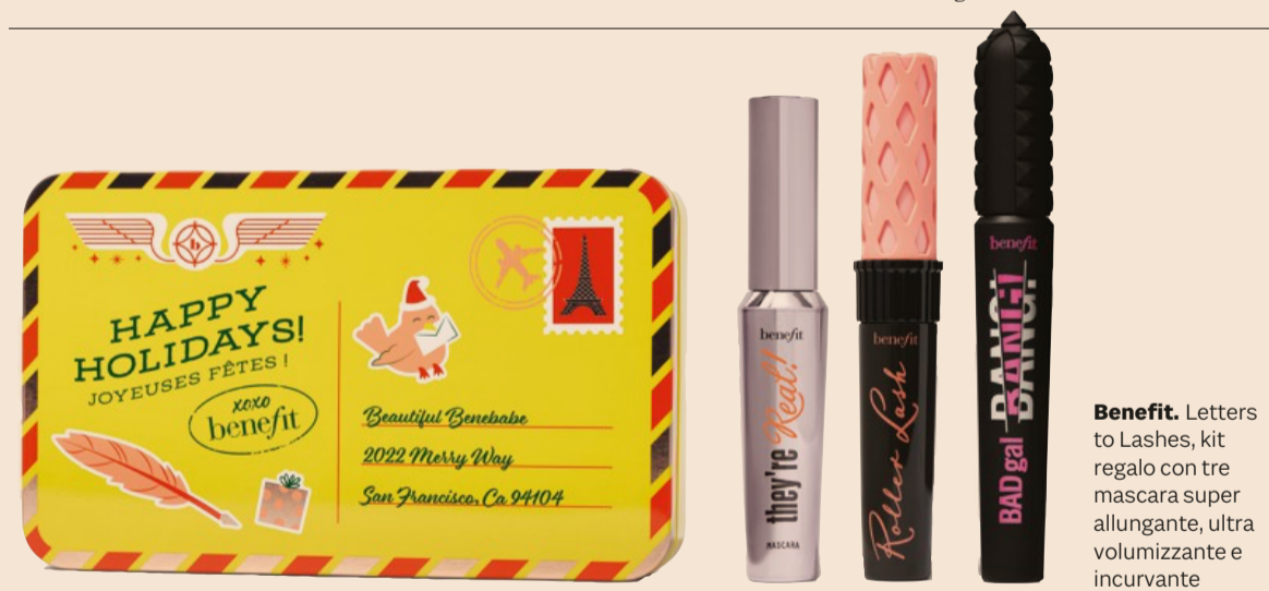
Benefit. Letters to Lashes, kit regalo con tre mascara super allungante, ultra volumizzante e incurvante