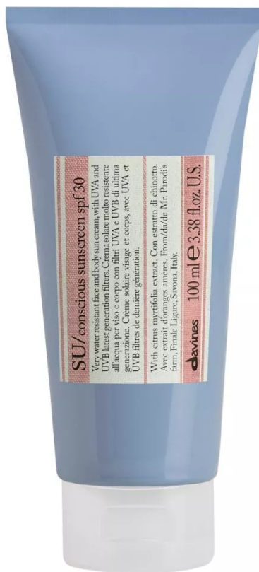
Su Conscious Sunscreen Spf 30 di Davines

Latte Corpo Antiossidante Spf 30 di Portonovo Suncare: un latte protettivo antiossidante ed emolliente certificato "Coral Safe" perché testato per preservare gli ecosistemi marini. Il prodotto fa parte della nuova start up Conero Beauty nata sul Monte Conero, che utilizza estratti delle piante autoctone del Parco Naturale Regionale del Monte Conero, con una filiera produttiva interamente Made in Marche.