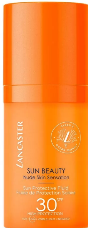
Sun Beauty Sun Protective Fluid Spf 30 di Lancaster

Sun Beauty Sun Protective Fluid Spf 30 di Lancaster: la sua texture si avvale di un sistema di filtri solari studiati per rispettare gli oceani e ridurre l'impatto sull'ambiente. Le linee sono realizzate con il 25% di filtri in meno rispetto alle precedenti linee di protezione solare Lancaster, senza che questo ne comprometta l'efficacia.