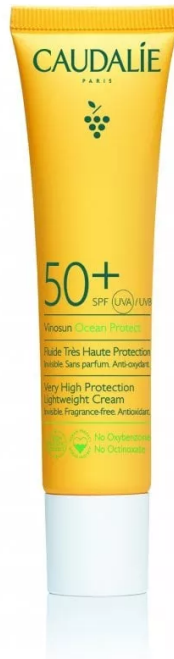
Vinosun Fluide Très Haute Protection Spf 50+ di Caudalie

Vinosun Fluide Très Haute Protection Spf 50+ di Caudalie: senza ossibenzone e octinoxato, questa protezione solare unisce 4 filtri ad ampio spettro che proteggono la pelle e rispettano l'ambiente con una formula altamente biodegradabile e non tossica per l'ecosistema marino. La confezione è in plastica riciclata e riciclabile al 100%. Inoltre, nel 2022, con il progetto 100% Plastic Collect, raccolgono il quantitativo di plastica utilizzata per le proprie produzioni e la trasformano in granuli pronti per riprodurre i pack delle proprie collezioni.