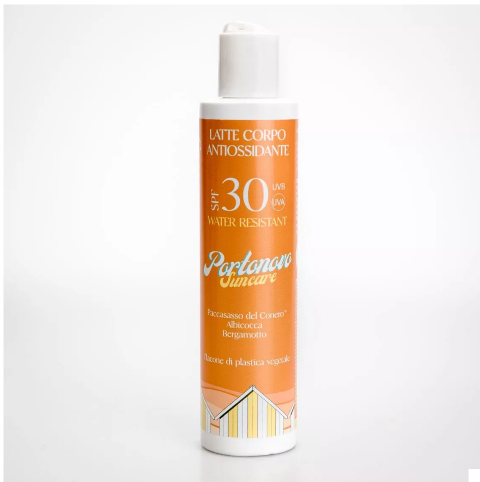
Latte Corpo Antiossidante Spf 30 di Portonovo Suncare

Latte Corpo Antiossidante Spf 30 di Portonovo Suncare: un latte protettivo antiossidante ed emolliente certificato "Coral Safe" perché testato per preservare gli ecosistemi marini. Il prodotto fa parte della nuova start up Conero Beauty nata sul Monte Conero, che utilizza estratti delle piante autoctone del Parco Naturale Regionale del Monte Conero, con una filiera produttiva interamente Made in Marche.