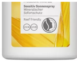
Sensitive Sun Spray Spf 30 di Lavera

Vinosun Fluide Très Haute Protection Spf 50+ di Caudalie: senza ossibenzone e octinoxato, questa protezione solare unisce 4 filtri ad ampio spettro che proteggono la pelle e rispettano l'ambiente con una formula altamente biodegradabile e non tossica per l'ecosistema marino. La confezione è in plastica riciclata e riciclabile al 100%. Inoltre, nel 2022, con il progetto 100% Plastic Collect, raccolgono il quantitativo di plastica utilizzata per le proprie produzioni e la trasformano in granuli pronti per riprodurre i pack delle proprie collezioni.