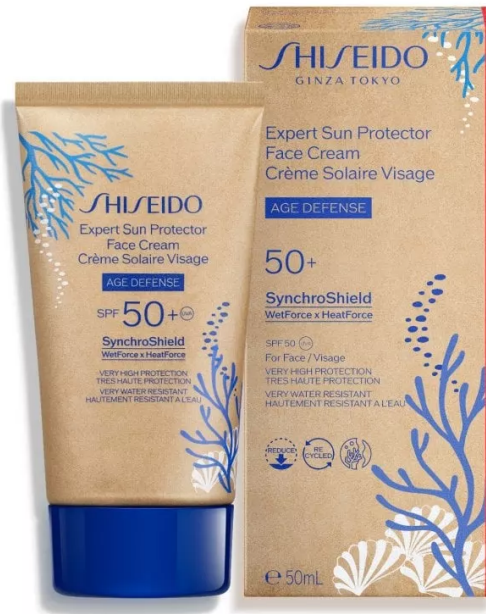
Expert Sun Protector Face Cream Spf 50+ di Shiseido

Expert Sun Protector Face Cream Spf 50+ di Shiseido: un potente scudo contro i raggi Uvb, combinato con un efficace filtro Uva (entrambi testati "Coral Safe"), per assicurare alla pelle protezione ad ampio spettro. Questo solare viso si basa sulla tecnologia SynchroShield, un velo protettivo che diventa più omogeneo e potente quando la pelle è esposta ad acqua o calore. Per questa edizione limitata si rinnova con un packaging più rispettoso dell'ambiente, con tubetti realizzati con il 48% in meno di plastica derivata dal petrolio. Inoltre, la sua formula è stata ricalibrata per ridurre la dispersione in mare.