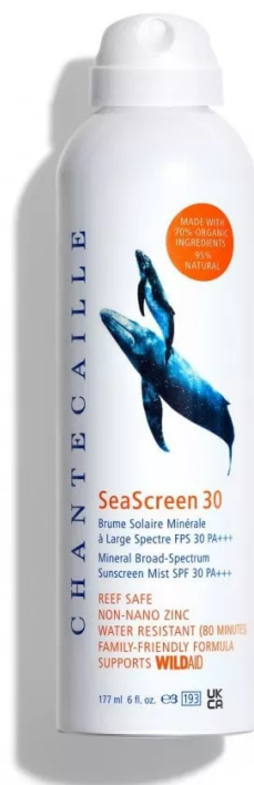
SeaScreen 30 Mineral Broad-Spectrum Sunscreen Mist SPF 30 PA+++ di Chantecaille

SeaScreen 30 Mineral Broad-Spectrum Sunscreen Mist SPF 30 PA+++ di Chantecaille : una protezione fisica naturale adatta a tutta la famiglia che usa filtri solari minerali, senza ossibenzone e ottinoxato, e senza sostanze chimiche che compromettono i sistemi della barriera corallina. La sua formula spray resistente all'acqua è arricchita con attivi botanici, che leniscono e si prendono cura della pelle. Con questo prodotto, Chantecaille supporta permanentemente il programma marino di WildAid in Tanzania, che punta a rafforzare la comunità e far rispettare e proteggere la vita marina della zona, fermando la pesca illegale.