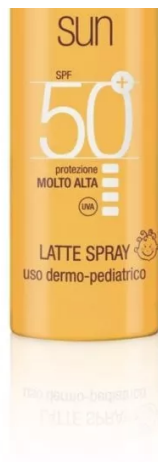
Sun Latte Spray Spf 50+ di Mediterranea

Hair & Body Protective Lotion Spf 15 di My.Organics: grazie alla tecnologia brevettata EcoSun Pass, contiene un filtro ecologicamente migliorato che garantisce un'ottima compatibilità ambientale proteggendo l'ecosistema marino. La sua formula miscela aloe vera, malva e carota per rivitalizzare, lenire e contrastare l'azione dei radicali liberi.