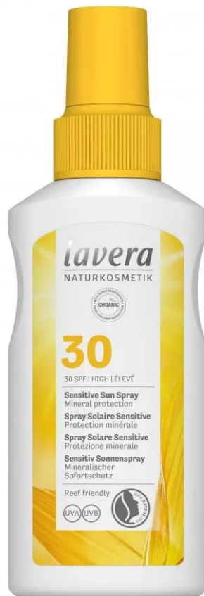
Sensitive Sun Spray Spf 30 di Lavera

Sensitive Sun Spray Spf 30 di Lavera: la sua formula reef-friendly e resistente all'acqua contiene solo filtri minerali (ossido di zinco e ossido di titanio) in ottemperanza alle leggi Hawaiane a tutela della barriera corallina, senza conservanti, coloranti e microplastiche. Inoltre, è arricchita con olio di semi di girasole e di cocco bio.