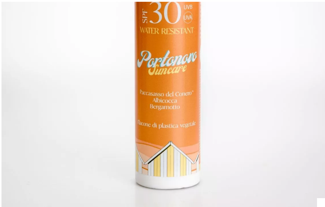
Latte Corpo Antiossidante Spf 30 di Portonovo Suncare

Expert Sun Protector Face Cream Spf 50+ di Shiseido: un potente scudo contro i raggi Uvb, combinato con un efficace filtro Uva (entrambi testati "Coral Safe"), per assicurare alla pelle protezione ad ampio spettro. Questo solare viso si basa sulla tecnologia SynchroShield, un velo protettivo che diventa più omogeneo e potente quando la pelle è esposta ad acqua o calore. Per questa edizione limitata si rinnova con un packaging più rispettoso dell'ambiente, con tubetti realizzati con il 48% in meno di plastica derivata dal petrolio. Inoltre, la sua formula è stata ricalibrata per ridurre la dispersione in mare.