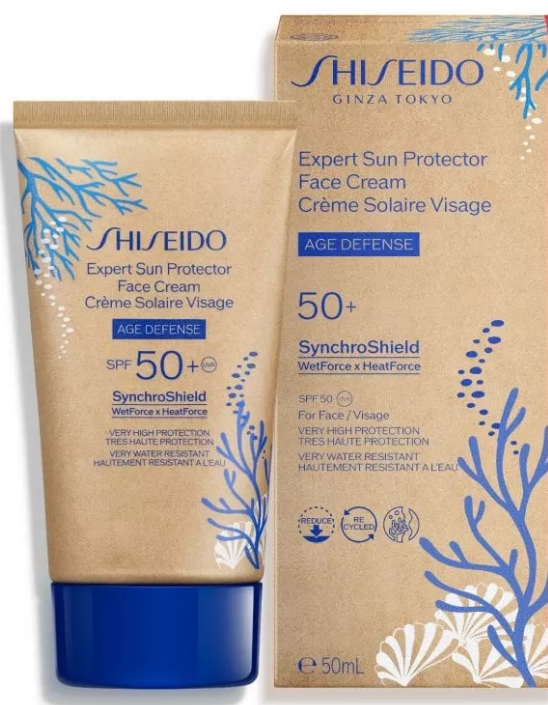
Expert Sun Protector Face Cream Spf 50+ di Shiseido

Expert Sun Protector Face Cream Spf 50+ di Shiseido: un potente scudo contro i raggi Uvb, combinato con un efficace filtro Uva (entrambi testati "Coral Safe"), per assicurare alla pelle protezione ad ampio spettro. Questo solare viso si basa sulla tecnologia SynchroShield, un velo protettivo che diventa più omogeneo e potente quando la pelle è esposta ad acqua o calore. Per questa edizione limitata si rinnova con un packaging più rispettoso dell'ambiente, con tubetti realizzati con il 48% in meno di plastica derivata dal petrolio. Inoltre, la sua formula è stata ricalibrata per ridurre la dispersione in mare.