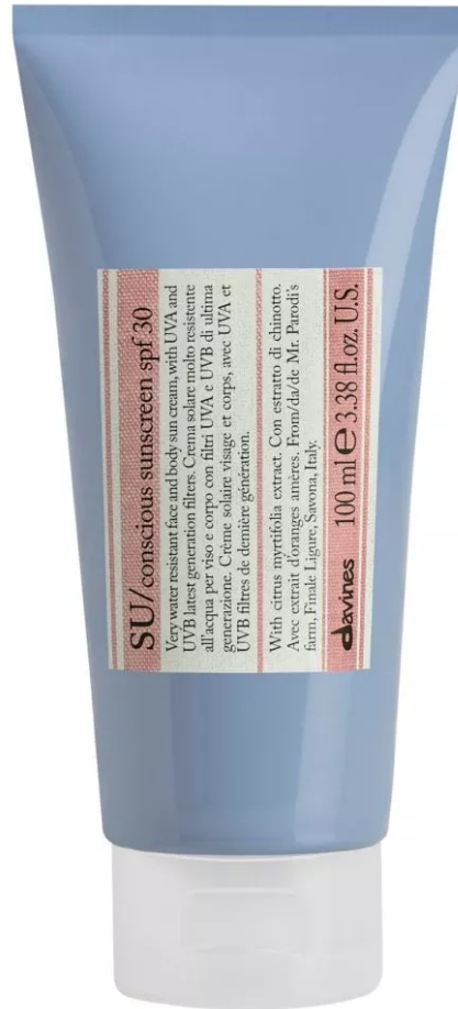
Su Conscious Sunscreen Spf 30 di Davines

Su Conscious Sunscreen Spf 30 di Davines: una crema solare resistente all'acqua con il 72% di ingredienti di origine naturale e filtri a minore tossicità acquatica, per un minore impatto ambientale. Arricchita con olio di abissinia, aiuta a rinforzare la barriera lipidica della pelle.