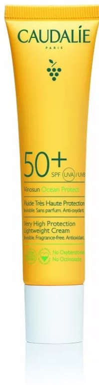
Vinosun Fluide Très Haute Protection Spf 50+ di Caudalie

Sun Latte Spray Spf 50+ di Mediterranea: adatta dai 3 mesi in poi, protegge dai raggi del sole grazie a una formula innovativa con un sistema di protezione Uv ad ampio spettro, stabile e completo. La sua formula reef-friendly, resistente all'acqua e studiata per un effetto antisabbia miscela un prebiotico naturale che rinforza la barriera della pelle, l'estratto di aloe, l'olio di mandorle e la vitamina E.