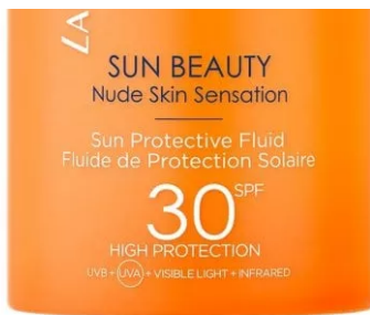
Sun Beauty Sun Protective Fluid Spf 30 di Lancaster

Sensitive Sun Spray Spf 30 di Lavera: la sua formula reef-friendly e resistente all'acqua contiene solo filtri minerali (ossido di zinco e ossido di titanio) in ottemperanza alle leggi Hawaiane a tutela della barriera corallina, senza conservanti, coloranti e microplastiche. Inoltre, è arricchita con olio di semi di girasole e di cocco bio.