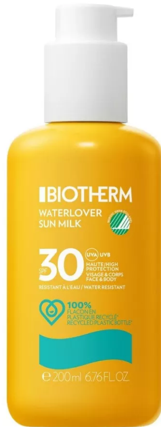
Waterlover Sun Milk Spf 30 di Biotherm

Waterlover Sun Milk Spf 30 di Biotherm: con una formula base biodegradabile al 97% e flaconi in plastica riciclata al 100%, questa protezione solare è pensata per ridurre al minimo l'impatto ambientale sugli ecosistemi acquatici. Le materie prime accuratamente selezionate rispondono a rigorosi requisiti ambientali e chimici, certificati e controllati dal Nordic Swan Ecolabel, certificazione che valuta l'impatto ambientale dell'intero ciclo di vita di un prodotto.