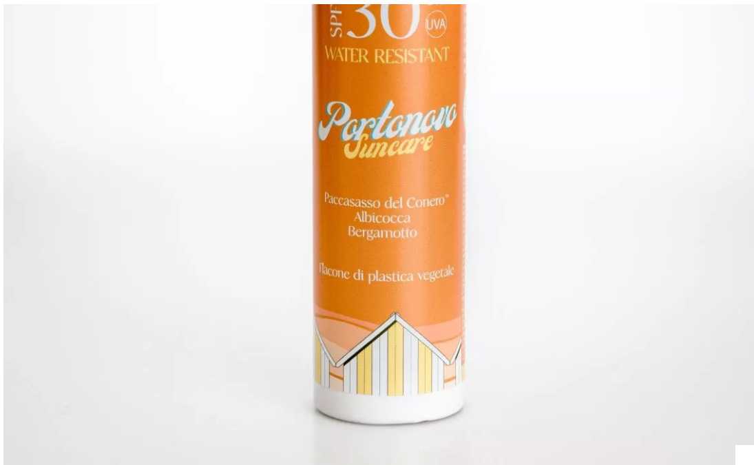
Latte Corpo Antiossidante Spf 30 di Portonovo Suncare

Expert Sun Protector Face Cream Spf 50+ di Shiseido: un potente scudo contro i raggi Uvb, combinato con un efficace filtro Uva (entrambi testati "Coral Safe"), per assicurare alla pelle protezione ad ampio spettro. Questo solare viso si basa sulla tecnologia SynchroShield, un velo protettivo che diventa più omogeneo e potente quando la pelle è esposta ad acqua o calore. Per questa edizione limitata si rinnova con un packaging più rispettoso dell'ambiente, con tubetti realizzati con il 48% in meno di plastica derivata dal petrolio. Inoltre, la sua formula è stata ricalibrata per ridurre la dispersione in mare.