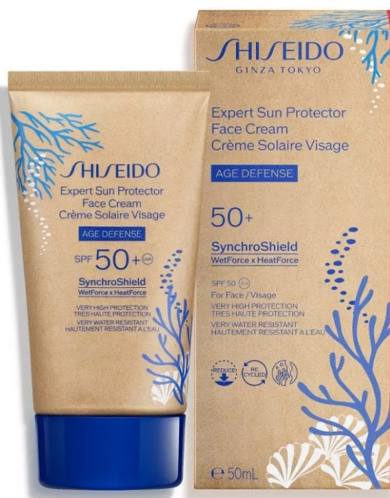
Expert Sun Protector Face Cream Spf 50+ di Shiseido

Expert Sun Protector Face Cream Spf 50+ di Shiseido: un potente scudo contro i raggi Uvb, combinato con un efficace filtro Uva (entrambi testati "Coral Safe"), per assicurare alla pelle protezione ad ampio spettro. Questo solare viso si basa sulla tecnologia SynchroShield, un velo protettivo che diventa più omogeneo e potente quando la pelle è esposta ad acqua o calore. Per questa edizione limitata si rinnova con un packaging più rispettoso dell'ambiente, con tubetti realizzati con il 48% in meno di plastica derivata dal petrolio. Inoltre, la sua formula è stata ricalibrata per ridurre la dispersione in mare.