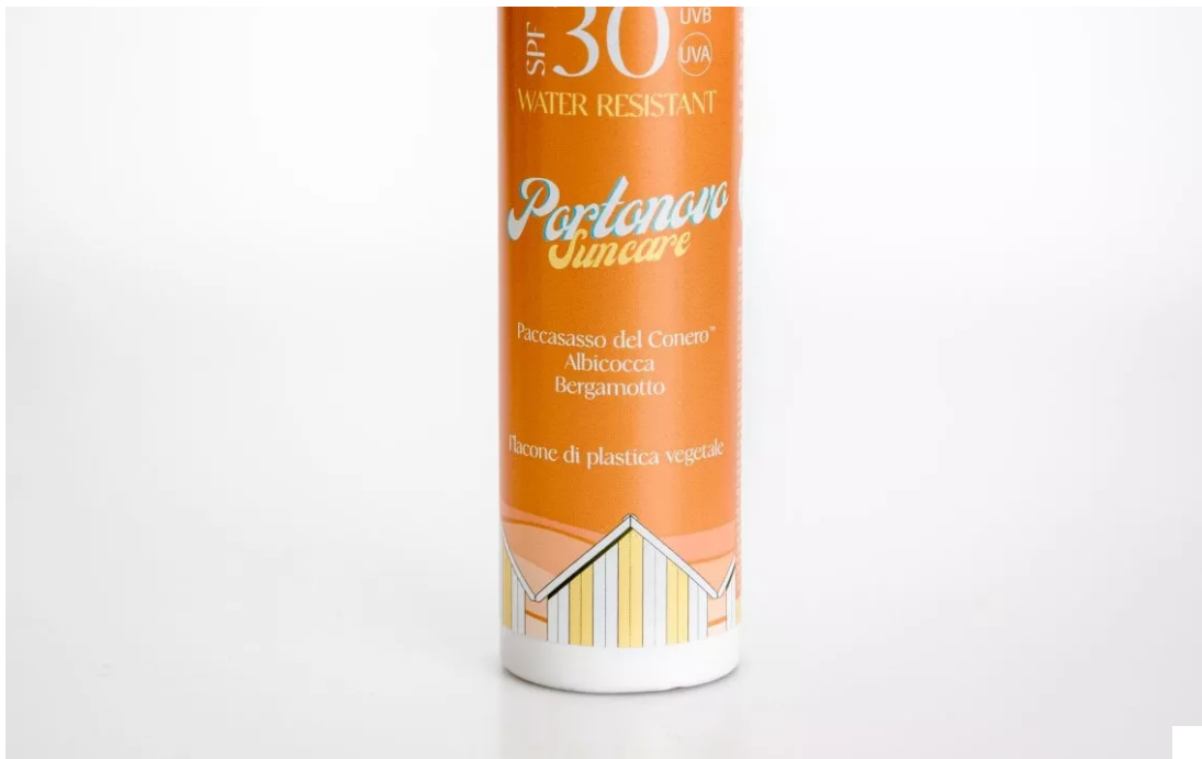
Latte Corpo Antiossidante Spf 30 di Portonovo Suncare

Expert Sun Protector Face Cream Spf 50+ di Shiseido: un potente scudo contro i raggi Uvb, combinato con un efficace filtro Uva (entrambi testati "Coral Safe"), per assicurare alla pelle protezione ad ampio spettro. Questo solare viso si basa sulla tecnologia SynchroShield, un velo protettivo che diventa più omogeneo e potente quando la pelle è esposta ad acqua o calore. Per questa edizione limitata si rinnova con un packaging più rispettoso dell'ambiente, con tubetti realizzati con il 48% in meno di plastica derivata dal petrolio. Inoltre, la sua formula è stata ricalibrata per ridurre la dispersione in mare.