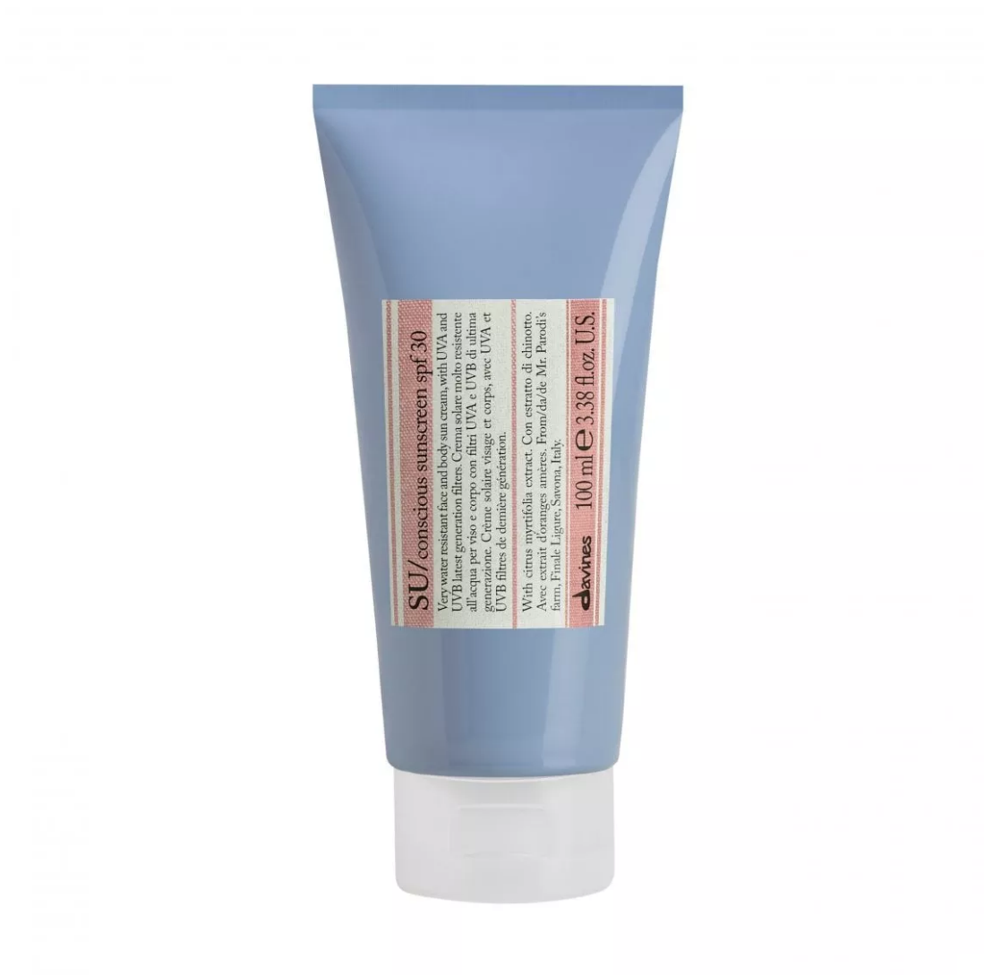
Su Conscious Sunscreen Spf 30 di Davines

Su Conscious Sunscreen Spf 30 di Davines: una crema solare resistente all'acqua con il 72% di ingredienti di origine naturale e filtri a minore tossicità acquatica, per un minore impatto ambientale. Arricchita con olio di abissinia, aiuta a rinforzare la barriera lipidica della pelle.