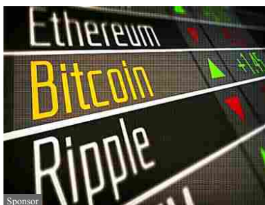
Bitcoin ad alta quotazione - conviene