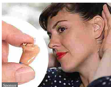
Ecco l'apparecchio acustico che sta